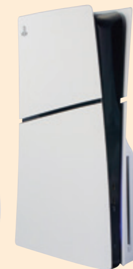
PlayStation®5 PlayStation 5 DualSense ワイヤレスコントローラー シングルパック +プレイステーション ストアカード10,000円分