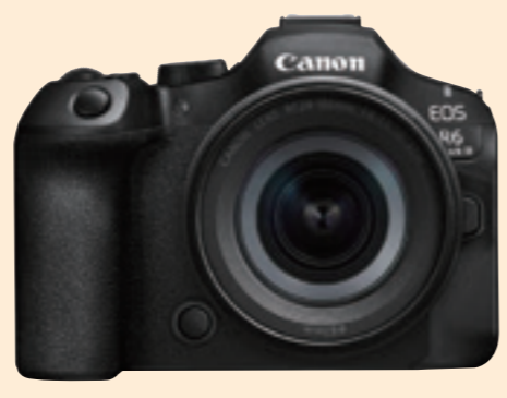
キヤノン ミラーレス一眼カメラ