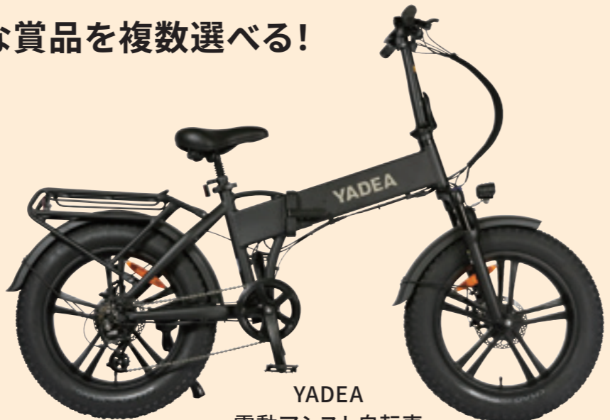
YADEA 電動アシスト自転車