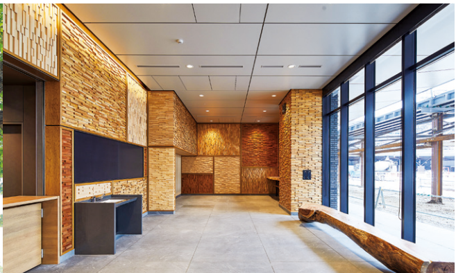
「カフェスタンド」(メインオフィス1F)