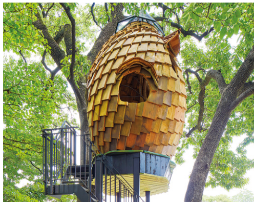
「ツリーハウス」(武蔵野自然林)