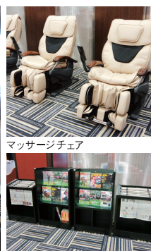
マッサージチェア