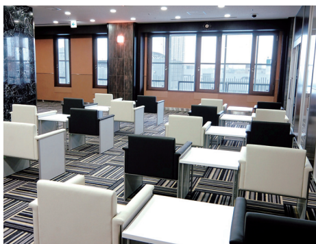
サービスラウンジ