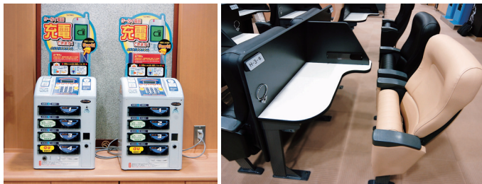
携帯電話充電コーナー