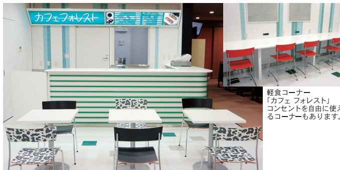
軽食コーナー「カフェフォレスト」コンセントを自由に使え、充電コーナーもあります。